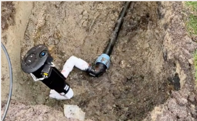
Réfections des arroseurs