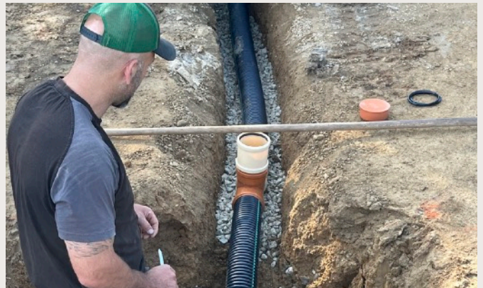
Bunker trou no 5