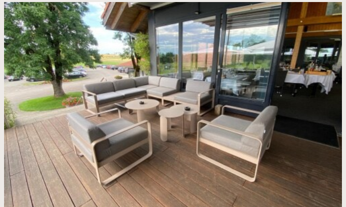
Acquisition mobilier de terrasse