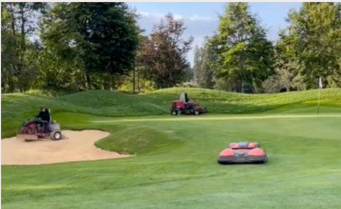
Acquisition des robots tondeurs