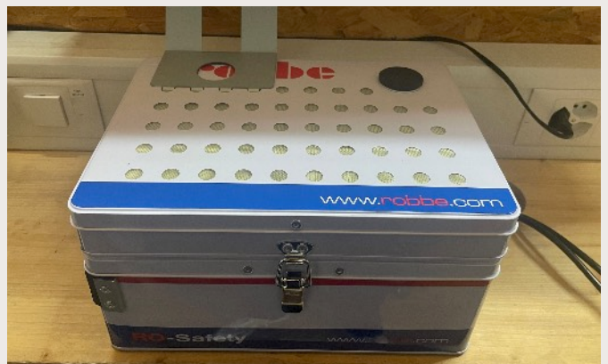
Installation des boîtes anti-feu